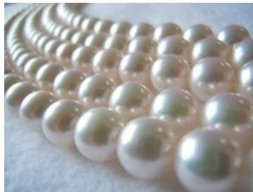
あこや真珠は、色や光沢感、輝きが特に美しく、女性達の永遠の憧れ、と言われることも。 ジュエリーオザワ