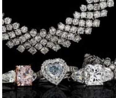
1月のIJTでも大人気! デティール、素材にこだわったトップクオリティのダイヤモンドジュエリーが揃います。 瑞勝