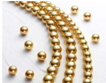
ゴージャス感が人気の南洋ゴールドパール。連相の優れたネックレス、大珠のルース等豊富に揃います。 大月真珠