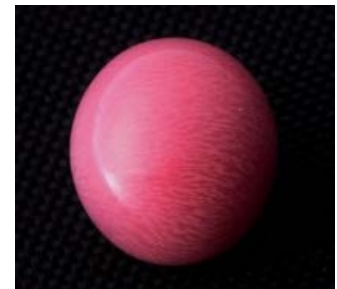
カリブ海で直接買い付けたというコンクパール。1つずつ異なるフレーム模様は思わず見入ってしまいそう。 近藤