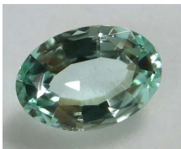
人気アニメ「宝石の国」で一躍有名になった希少石フォスフォフリイトが出展! 既に絶産した超希少石です。 マテリアルアート/ジェムワークス