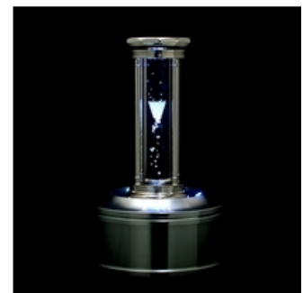
砂ではなく、宝石が時間を刻む宝石の砂時計『アワーグラス』。ダイヤモンド100ct使用のものは必見! レインボーダイヤモンド