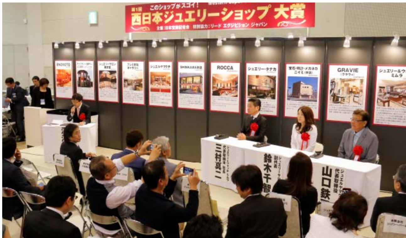
前回(2017年)西日本ジュエリーショップ大賞 パネルディスカッションの様子

日本宝飾記者会が主催の、市場活性化に長けた西日本の小売店を表彰する『第2回 西日本ジュエリーショップ大賞』の表彰式を、昨年に引き続き、IJK 展示会場で、会期 2 日目 17 日(木)の 15 時から行うこととなった。