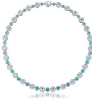
ブラジル産パライバトルマリンとエクセレントカットダイヤモンドをゴージャスにあしらったプラチナネックレス。 近藤宝飾