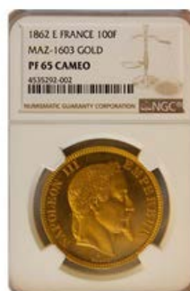
1862年発行のナポレオン3世(有冠タイプ)の100フラン試鑄金貨が特別出品! 超希少な世界最高鑑定品です。 コインパレス