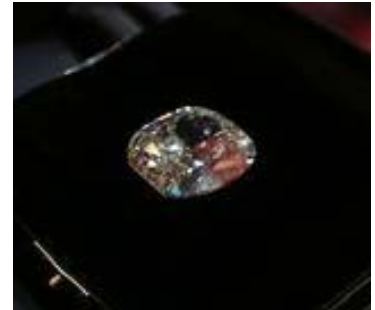
小さくても価値の高い、高品質なダイヤモンドは、価値の安定感から資産として購入する人も多くなっています。 石井商店